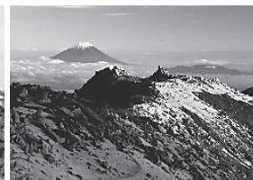
令和3年1月号表紙作品

●送付先 〒210-0026 川崎市川崎区堤根34-15 (公財)川崎市シルバー人材センター 経営課内 会報編集委員会事務局迄 ●応募方法 ①氏名 ②住所 ③電話番号 ④L判又は2L判に印刷した作品 ※作品にはタイトル(コメントがあれば100文字以内で)を添えてご郵送ください。