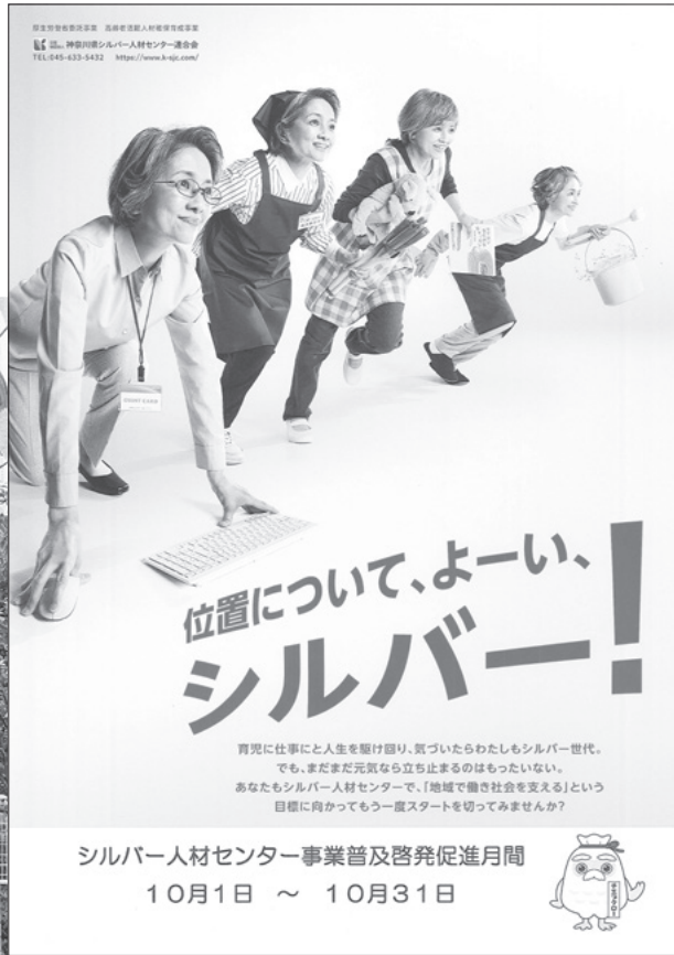
普及啓発促進ポスター

全国のシルバー人材センターでは、毎年10月を「シルバー人材センター事業普及啓発促進月間」と定め、全国シルバー人材センター事業協会を中心として「普及