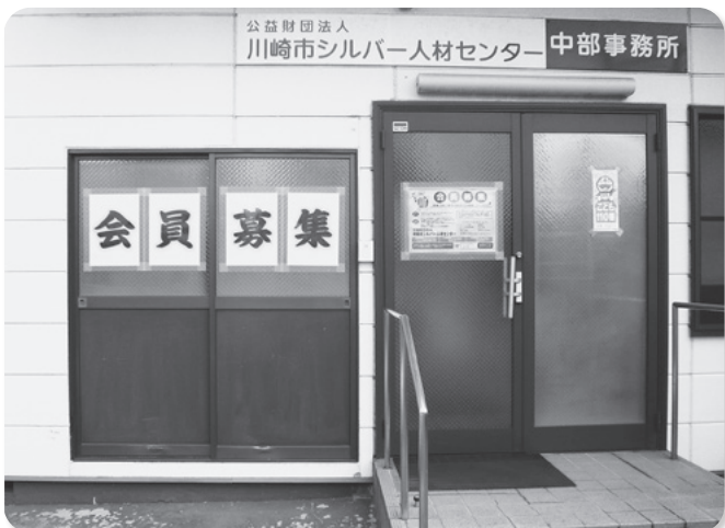
中部事務所入口の「会員募集ポスター」