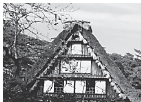
令和2年1月号表紙作品

●応募締切 令和3年12月10日(金) ※応募された作品は、事務局で選考のうえ、「表紙」または「会員のひろば」に掲載させていただきます。 ※採用された方には、QUOカードを贈呈いたします。