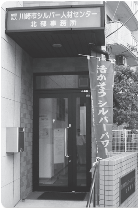
北部事務所入口の「のぼり旗」