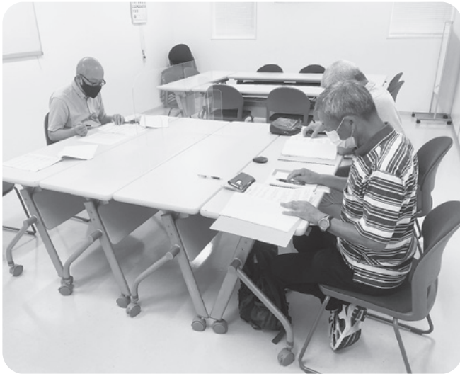
除草説明会の様子 (南部事務所)

参加者からは、作業方法の確認や、就業依頼書・見積書・就業報告書等、各種書類の取扱いについての質問がありました。